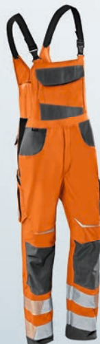
Warnorange | Anthrazit 44-64, 90-114, 23-31, 23K-31K