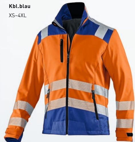
Warnorange | Kbl.blau XS-4XL