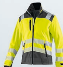
Warngelb | Anthrazit XS-4XL