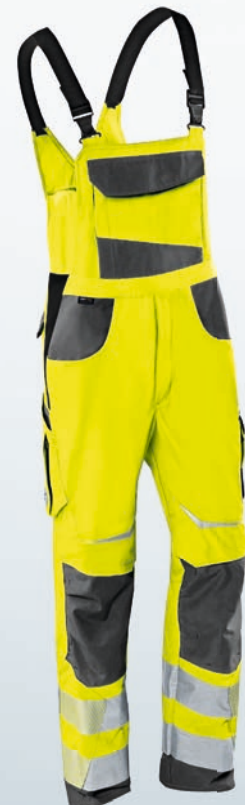
Warngelb | Anthrazit 44-64, 90-114, 23-31, 23K-31K