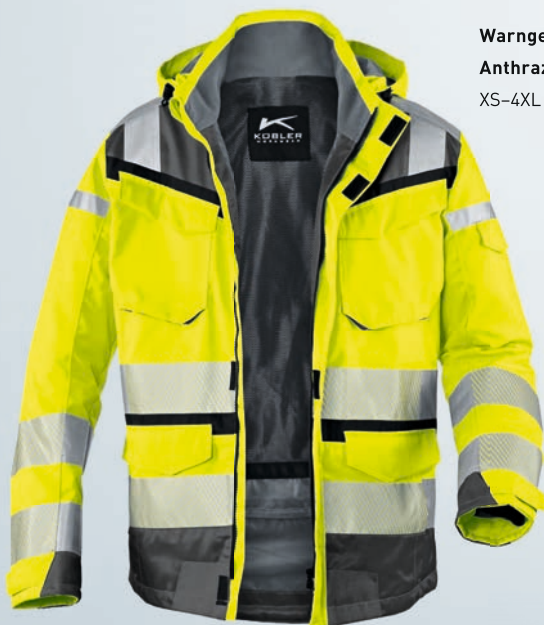
Warngelb | Anthrazit XS-4XL

Erfüllt alleine getragen WARNSCHUTZKLASSE 3