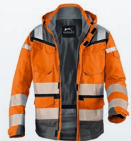
Warnorange | Anthrazit XS-4XL