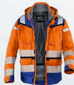
Warnorange | Kbl.blau XS-4XL