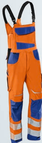
Warnorange | Kbl.blau 44-64, 90-114, 23-31, 23K-31K