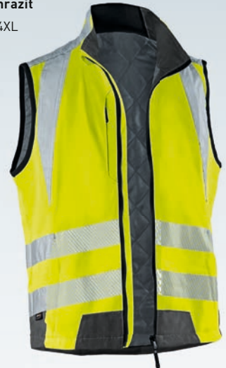
Warngelb | Anthrazit XS-4XL