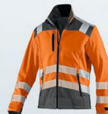
Warnorange | Anthrazit XS-4XL